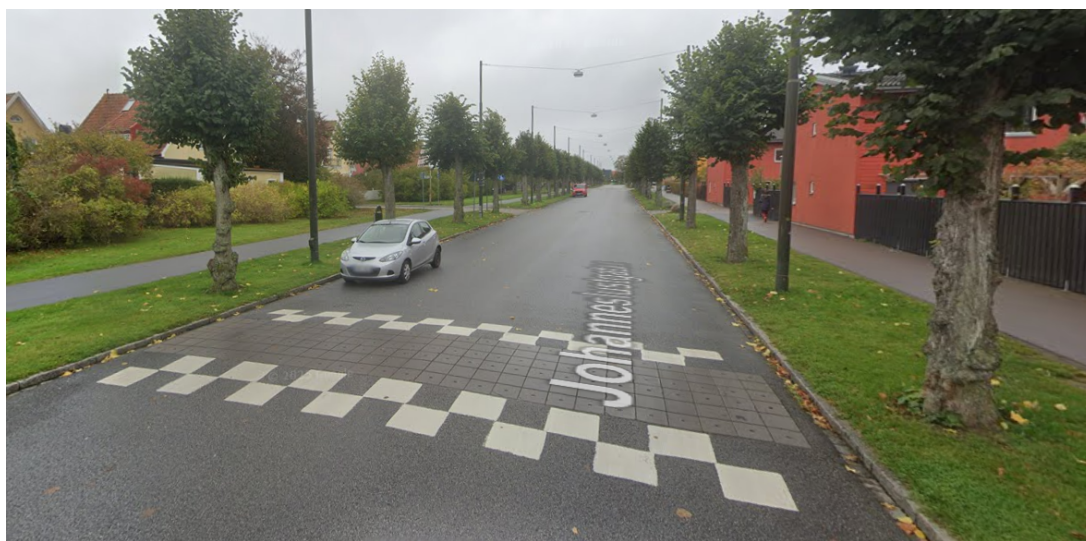
Figur 3. Farthinder på Johanneslustgatan mellan Sjöbogatan och Silvåkragatan.

Johanneslustgatan är nio meter bred i den södra delen och sju meter bred i den norra delen. Det finns en kombinerad gång- och cykelbana längs den västra sidan mellan Sallerupsvägen och Revingehedsgatan. Via Veberödsgatan finns det möjlighet för cyklister att nå cykelstråk i Mölledalsgatan vidare mot Kirseberg. Längs den östra sidan finns en gångbana, men i den norra delen mellan Revingehedsgatan och Mölledalsgatan saknas ett tillgängligt gångstråk då det endast finns en smal grusgång med en rad plattor. Johanneslustgatan trafikeras inte av kollektivtrafik.