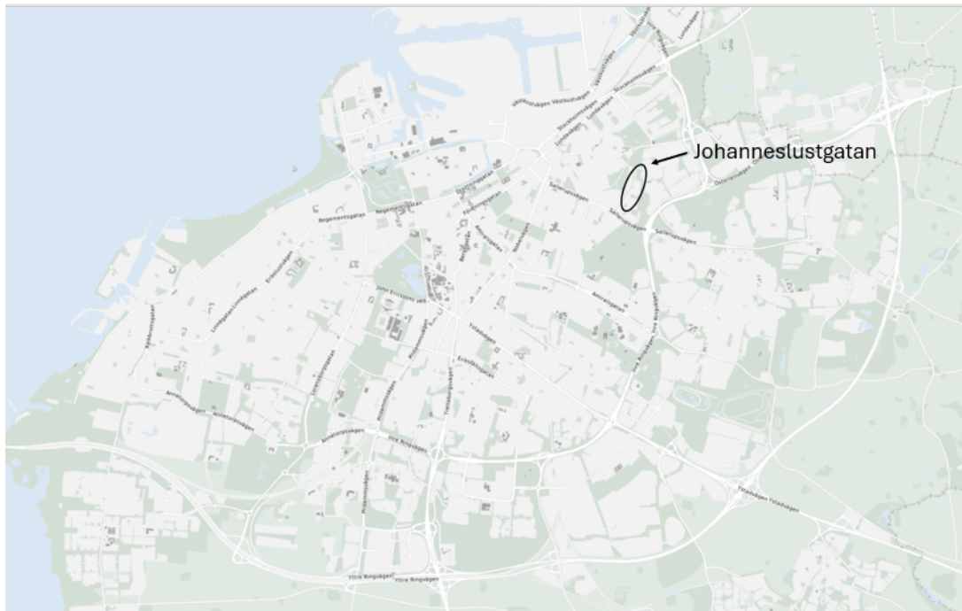
Figur 1. Johanneslustgatans placering i Malmö.